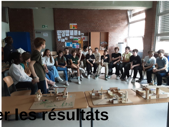
Présenter les résultats