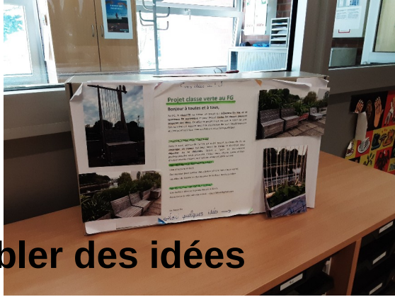
Rassembler des idées