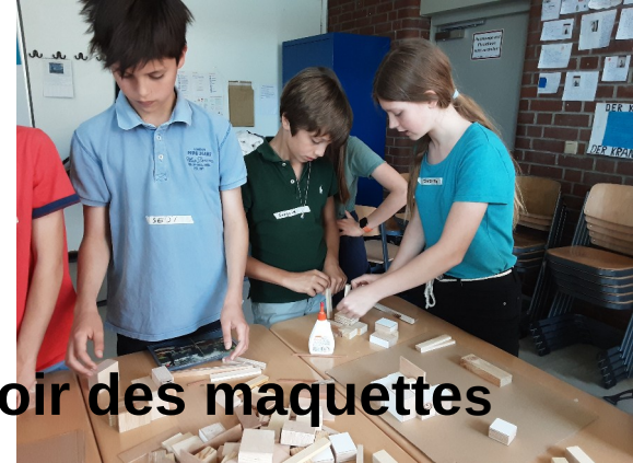
Concevoir des maquettes